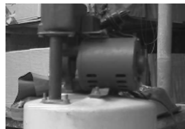
b. Gambar Visual