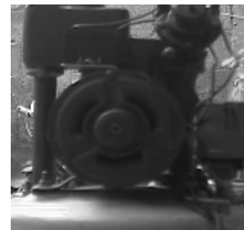
b. Gambar visual