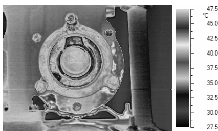
a. Pola Distribusi Suhu

tersebut intensitas infra merah lebih tinggi karena adanya pantulan radiasi infra merah dari lingkungan di sekitarnya. Hal ini disebabkan karena geometri lekukan yang bervariasi dari 0° hingga 90° dan secara otomatis memberikan efek pantul dari radiasi di sekelilingnya. Dalam hal ini radiasi infra merah yang ditangkap oleh kamera tidak murni berasal dari suhu material namun karena adanya pantulan dari kondisi di sekelilingnya yang bersifat noise.