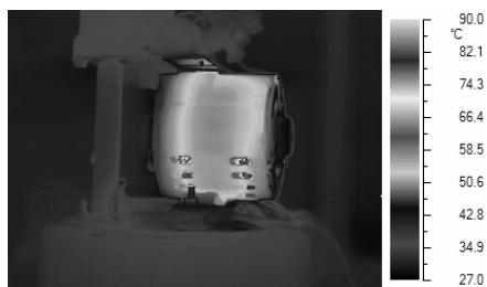
a. Pola Distribusi Suhu

PTRKN memiliki kamera infra merah yang dapat merekam pola atau distribusi suhu suatu permukaan. Dengan menggunakan kamera ini, inspeksi thermography dilakukan