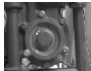
b. Gambar Visual