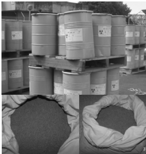
Gambar 1. Limbah Resin dalam Drum Volume 100 Liter

Analisis kuantitatif terhadap limbah radioaktif resin diperlukan untuk mengetahui tingkat konsentrasi radioaktivitas resin sehingga dapat diperhitungkan nilai aktivitas limbah resin yang ditimbulkan dari masing-masing sistem pemurnian air pendingin primer. Analisis kualitatif dapat bermanfaat untuk penanganan dalam pengolahan limbah berikutnya. Hasil analisis kualitatif dan kuantitatif dapat dipergunakan sebagai bahan kajian dari sistem pemurnian air atau struktur komponen reaktor. Dari uraian analisis yang dilakukan dapat pula diusulkan metode penanganan atau pengolahan limbah resin yang lebih baik (menguntungkan) untuk menjawab kekurangan yang ditemukan.