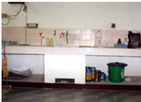
Gambar. 1. Bak Pencuci dan Tempat Preparasi

Untuk bak pencuci dan tempat preparasi dapat dilihat dalam Gambar.1.