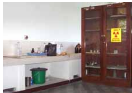
Gambar 2 .Sekat Lemari Bahan Kimia

Laboratorium Proteksi Rasiasi/ ADPR dapat dilihat pada Gambar 2 dan Gambar 3.