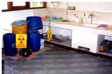
Gambar 3. Tempat Limbah, Lantai, Bak Pencuci dan Tempat Preparasi.