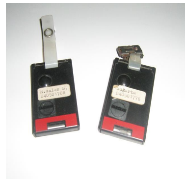
Gambar 1. Contoh TLD

pengukurannya setelah bekerja, survaimeter justru harus digunakan sebelum dan selama bekerja. Survaimeter lebih diutamakan untuk mengukur radiasi eksterna seperti radiasi \gamma , sinar-X dan netron, tetapi ada juga untuk radiasi \alpha dan \beta . Contoh survaimeter yang digunakan untuk pemantau paparan radiasi di IEBE, dapat dilihat pada Gambar 2.