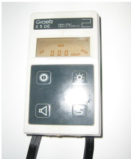
Gambar 2. Contoh Survaimeter radiasi \gamma